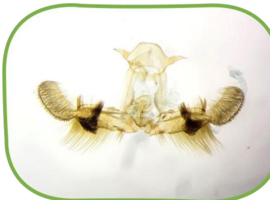
세부구조 해부 검경