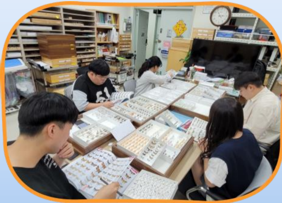
표본 제작, 분류 및 동정 작업