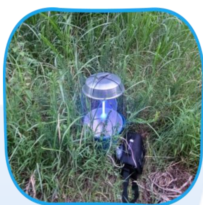
주/야간 채집 조사